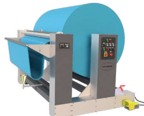
ICZ 1600 UNW S