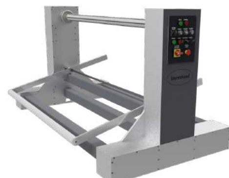
ICZ 1600 UNW E

ENTWICKELT FÜR DAS AB-/ZUWICKELN ALLER ARTEN VON MATERIALIEN