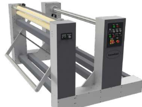
ICZ 1600 UNW R