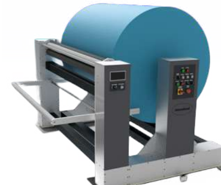
ICZ 1600 UNW SC